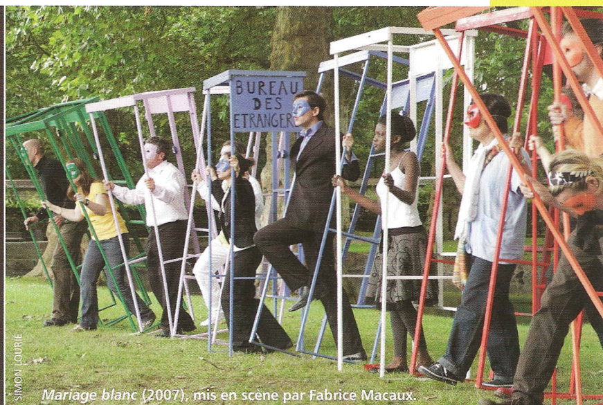
Mariage blanc (2007), mis en scène par Fabrice Macaux.